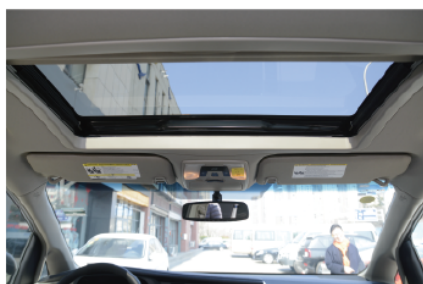
- 可以开启的大尺寸天窗