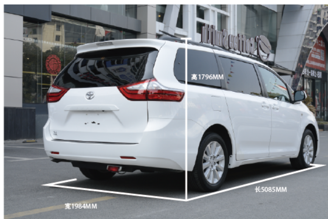
- 全方位超越中大型SUV的三围