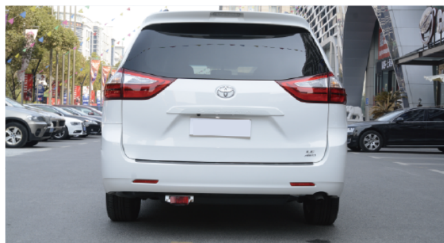
- 宽厚尾部为了提供更大的内部空间