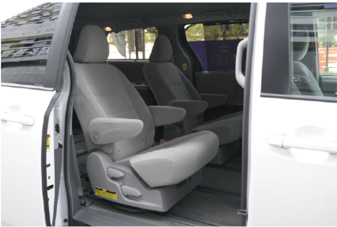
超大实用性空间，满足一家人出行的任何需求