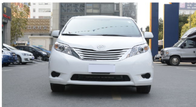
- 横条进气格栅，搭配显气质的镀铬的边框