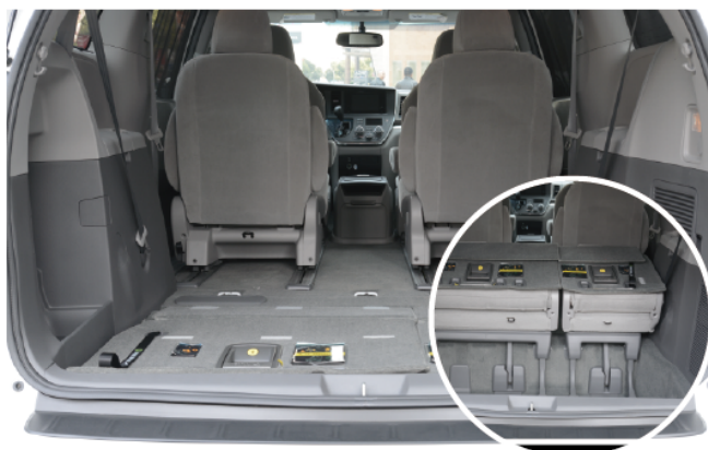
- 更加人性化的操作体验, 只需一按, 即可升起/折叠第三排座椅