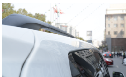
- 车顶行李架可以提供出游时的更多功能