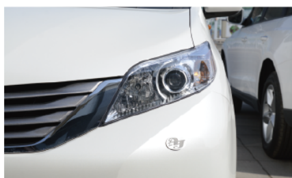
- 有别美式惯用卤素灯的氙气大灯