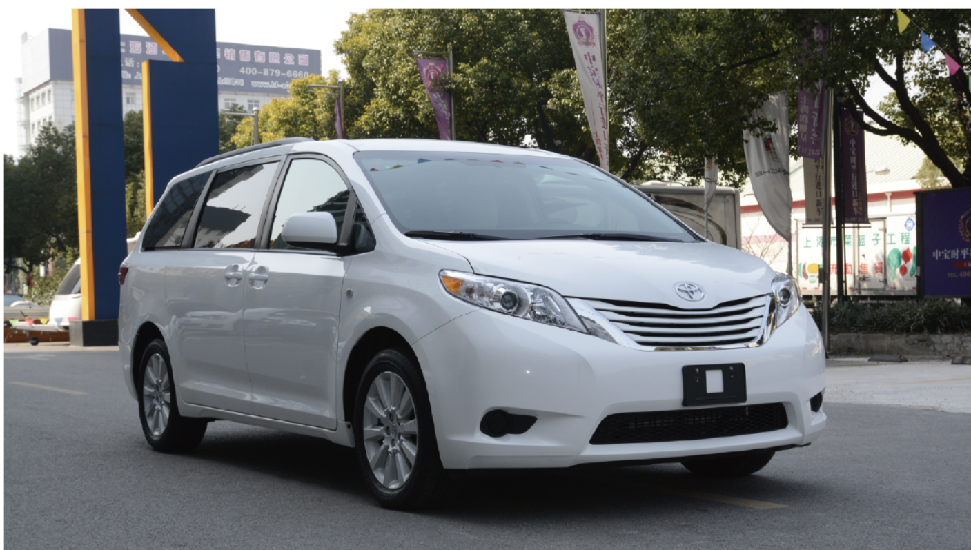
丰田 塞纳 2016款 XLE 两驱