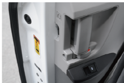
- 中门滑动开关把手带有儿童锁保证安全