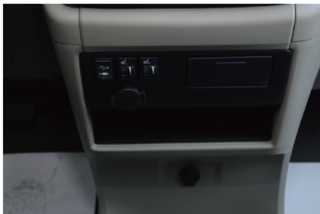
- 中控台可以控制座椅加热、点烟器和USB接口AUX接口