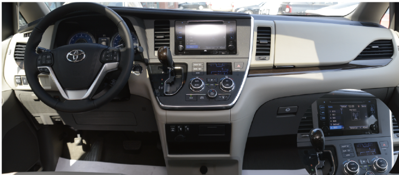
- 科技感驾驶台设计, 带有木纹装饰, 为前排留下充足的空间