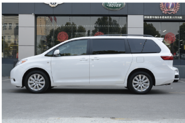
- 修长下沉的车身显得稳重