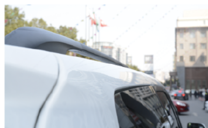
- 不仅车内空间实用，顶部行李架可放置更多的物件