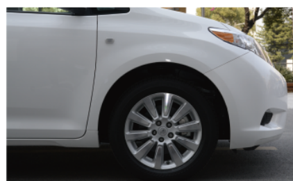
- 18寸的10幅造型轮毂，兼顾了舒适和视觉的需求