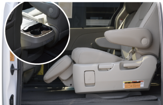
- 第二排独立座椅带有调节的脚部支撑, 并且有独立的杯架