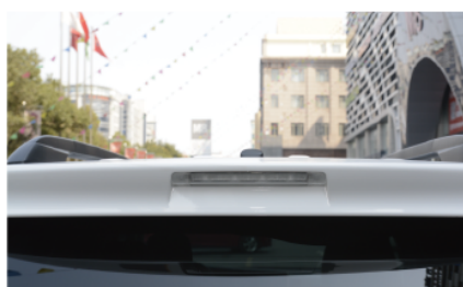
- 隐藏式的雨量雨刷美观又实用