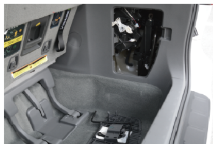
- 备胎工具隐藏在后备箱右侧